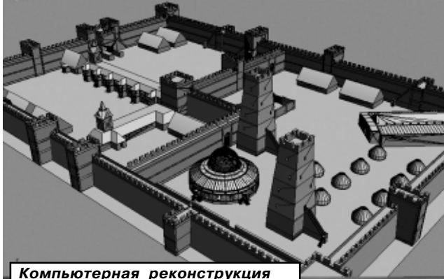
Компьютерная реконструкция Саркела - в векторе и 3Д

- Губернаторская программа развития туристического комплекса в Ростовской области. Активность в этом направлении проявил Цимлянский район: собственник винзавода выделил 80 миллионов рублей на строительство стилизованной казачьей деревни. Не отстает и станция Романовская со своей четырехвековой историей и традициями – преобразается ее на-